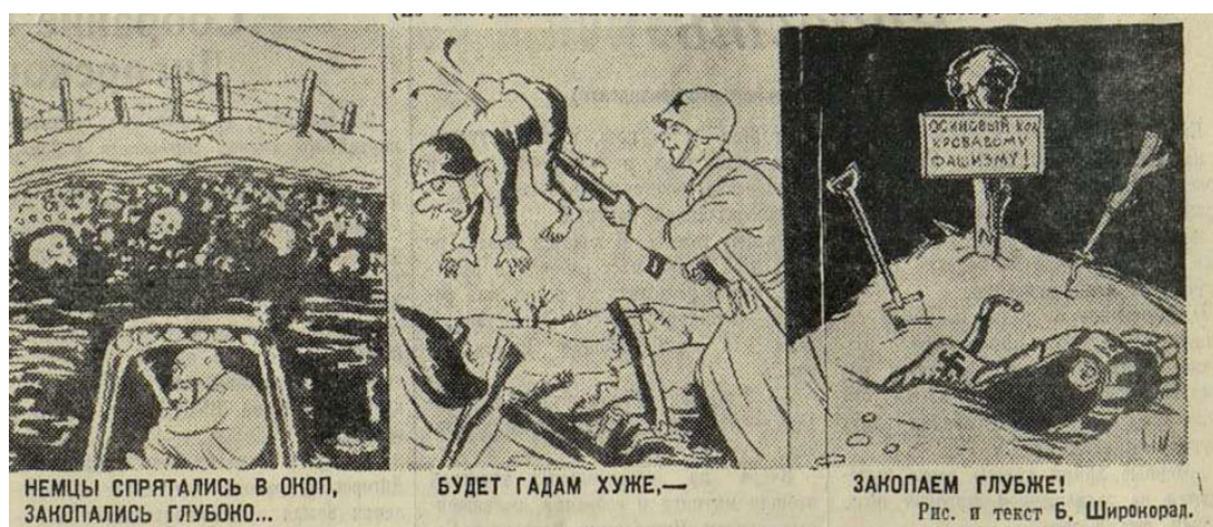
Рис. 2. Закопаем врага.