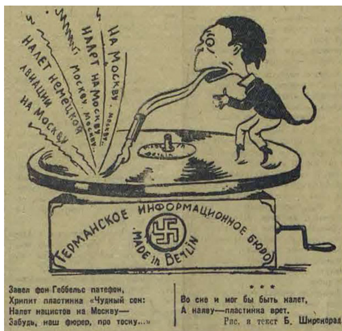
Рис. 5. Геббельс и его ложь.