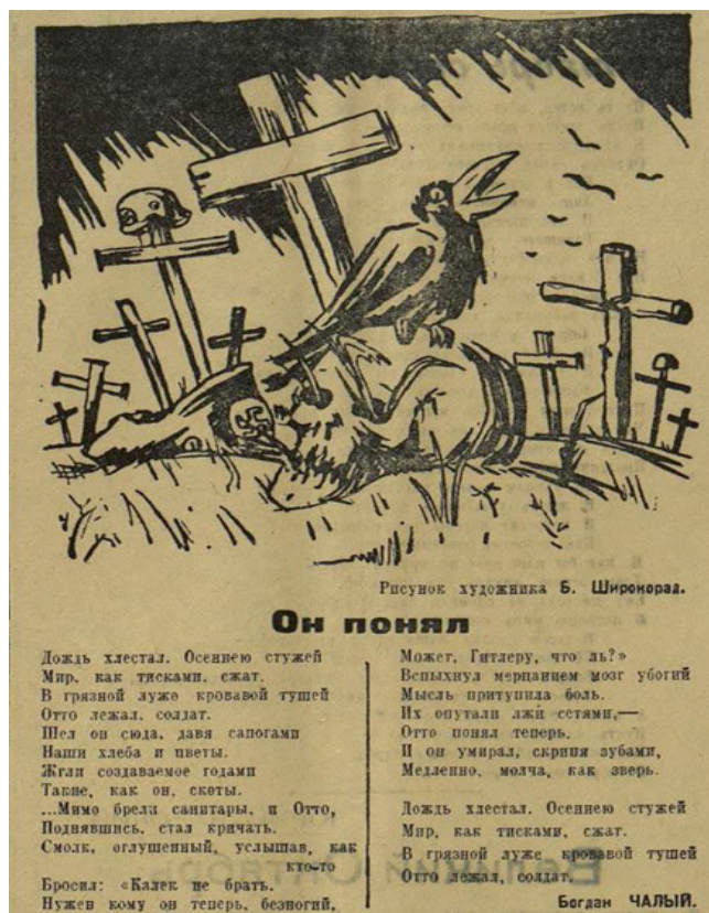
Рис. 4. Конец авантюры.

ская армия искусно маневрировала при отходе с боями, и немцы не могли нанести ей сокрушительного удара...» [16]. В итоге битва за Кавказ была фашистами проиграна, что вызвало большое неудовольствие фюрера, который обрушился на Клейста с обвинениями в непрофессионализме.