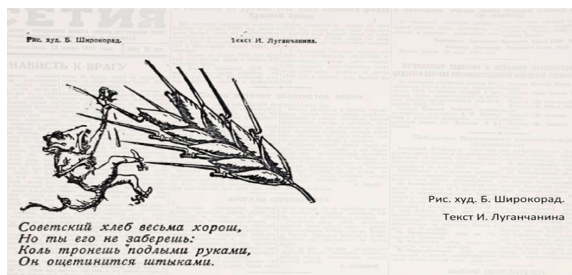
Рис. 1. Планы Гитлера.

Первая карикатура Б.Н. Широкограда была опубликована в газете в конце июля 1941 г. Можно определить несколько тем для сатирических сюжетов. Прежде всего, это А. Гитлер и его ближайшие сподвижники, фашистские военные, союзники Германии. Отметим, что карикатуры вполне реалистичны, герои узнаваемы. Так, Гитлер изображен всегда в военной форме, но как-то нелепо сидящей на нем, непропорциональное тело с большой головой, в которой масса чудовищных планов, истерические жесты – все выдает в нем параноика. Он обуреваем идеей мирового господства, не обращая внимания на реальное положение дел. Гитлеровская пропаганда убеждает его и свой народ в том, что армия скоро захватит Москву и Ленинград, практически не встретив на своем пути сопротивления. Эти пропагандистские уловки легко разбиваются о реальное положение дел (рис. 1).